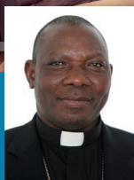
Referente del progetto: S.E. Monsignor Oliver Dashe Doeme, vescovo di Maiduguri